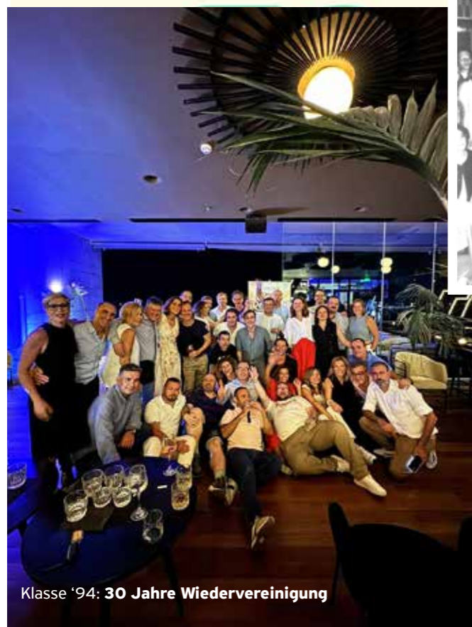
Klasse '94: 30 Jahre Wiedervereinigung