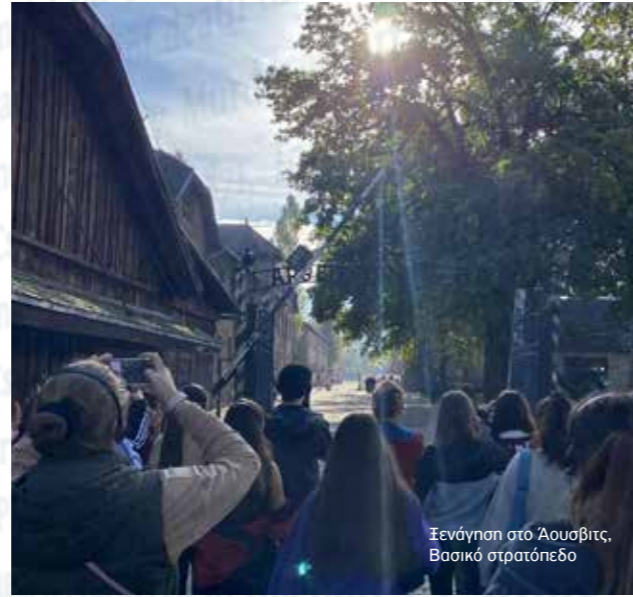
Ξενάγηση στο Άουσβιτς, Βασικό στρατόπεδο

ΟΜΙΛΟΣ ΕΡΓΑΣΙΑΣ ΤΗΣ ΓΕΡΜΑΝΙΚΗΣ ΣΧΟΛΗΣ ΘΕΣΣΑΛΟΝΙΚΗΣ