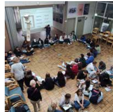
Workshop γλωσσικής εμπύκωσης

■ Την πρώτη ημέρα, η ομάδα επισκέφθηκε την κύρια έκθεση και τους χώρους του πρώην κύριου στρατοπέδου Άουσβιτς I. Τη δεύτερη ημέρα, η ομάδα επισκέφθηκε επιλεγμένους χώρους που σχετίζονται με τη μαζική εξόντωση του εβραϊκού λαού και την εξόντωση των υπόλοιπων ομάδων θυμάτων στο πρώην