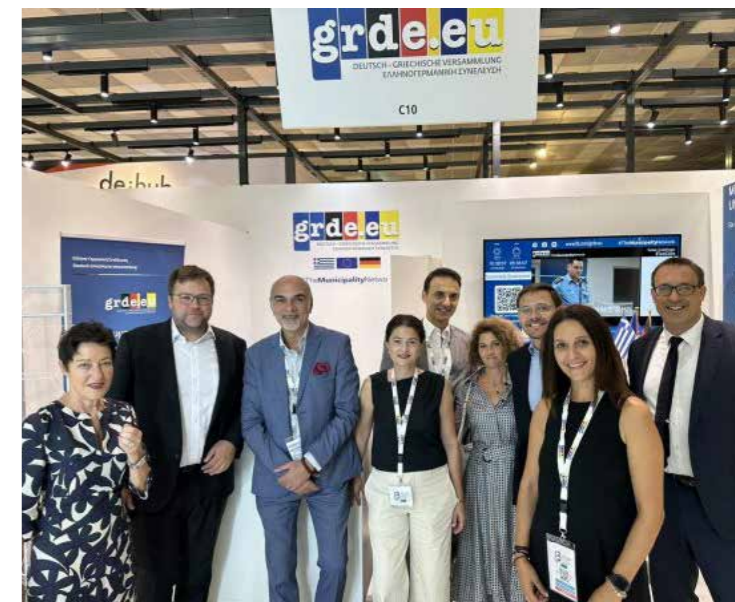
Η Ελληνογερμανική Συνέλευση στη Διεθνή Έκθεση Θεσσαλονίκης

Σημαντική ήταν φυσικά και η εστίαση στις επενδυτικές σχέσεις των δύο χωρών. Η Γερμανία είναι ήδη ένας από τους μεγαλύτερους ξένους επενδυτές στην Ελλάδα, ειδικά στους τομείς της ενέργειας, των υποδομών και των μεταφορών. Με την παρουσία της ως τιμώμενης χώρας στη ΔΕΘ, η Γερμανία επεδίωξε να διευρύνει αυτούς τους δεσμούς, προωθώντας νέες επενδύσεις, ιδιαίτερα στον τομέα της ψηφιακής οικονομίας και της πράσινης ανάπτυξης. Οι γερμανικές επιχειρήσεις βλέπουν στην Ελλάδα μια χώρα με σημαντικές προοπτικές ανάπτυξης, ειδικά μετά τις μεταρρυθμίσεις που έχουν γίνει τα τελευταία χρόνια, ενώ η ΔΕΘ προσέφερε το ιδανικό πεδίο για τη διερεύνηση νέων επενδυτικών ευκαιριών.