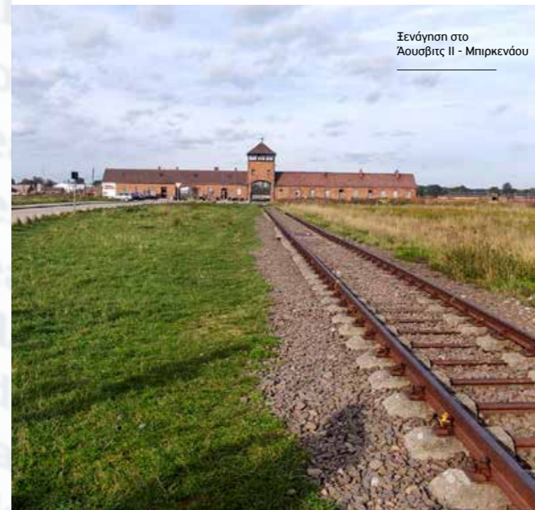
Ξενάγηση στο Άουσβιτς II - Μπίρκεναού

Το Οσβιέσιμ, μια πόλη με ιστορία άνω των 800 ετών και πληθυσμό περίπου 40.000 κατοίκων σήμερα, είναι παγκοσμίως γνωστό ως Άουσβιτς. Στην ιστορική περιήγηση που διοργάνωσε το IYMC, παρουσιάστηκαν σημαντικά στοιχεία για την ιστορία αυτής της πόλης: η ίδρυση της πόλης και η ανάπτυξή της, η τύχη της εβραϊκής κοινότητας του Οσβιέσιμ, η οποία αριθμούσε περίπου 7.000 μέλη πριν από τον πόλεμο, η ιστορία της μοναδικής συναγωγής, που ανακαινίστηκε το